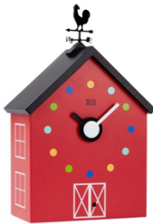
KooKoo RedBarn Seitenansicht II