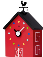
KooKoo RedBarn Seitenansicht I