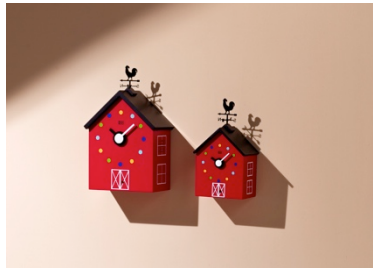
KooKoo RedBarn beide Varianten