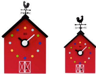
KooKoo RedBarn große und kleine Variante im Vergleich