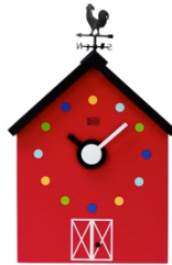
KooKoo RedBarn Frontansicht